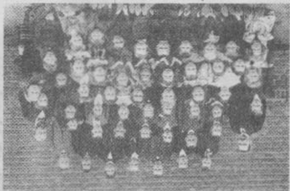
Die Leistung, Hasenohr oder Ehrenbürger von Marburg? Offensichtlich